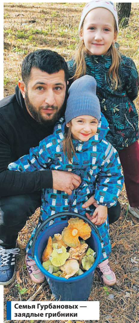
Семья Гурбановых — заядлые грибники

В самом конце приготовления добавьте немного молотого перца. Снимите с огня и дайте борщу немного настояться, минут 10-15. При подаче в каждую порцию можно добавить зелень и сметану.