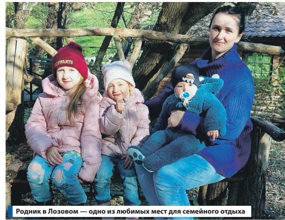
Родник в Лозовом — одно из любимых мест для семейного отдыха