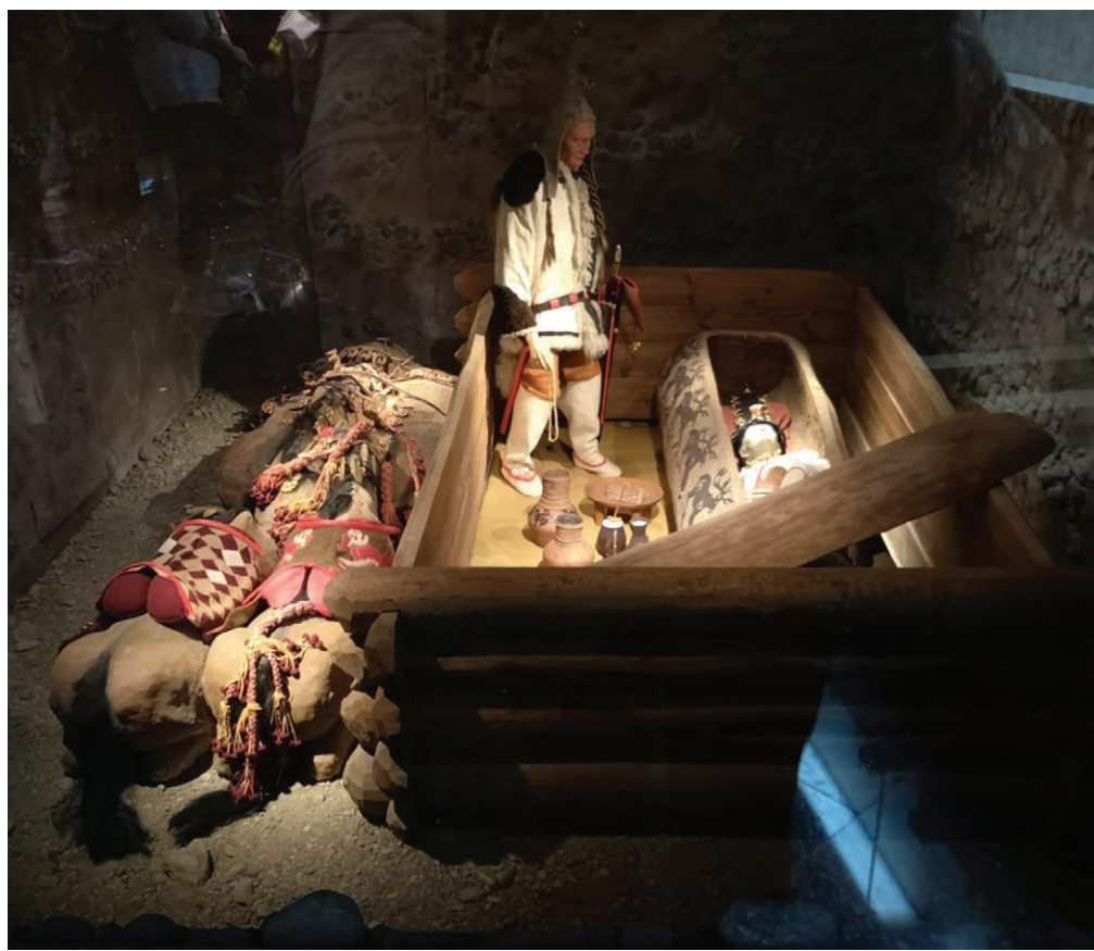
■ В Горно-Алтайске, в Национальном музее имени А. В. Анохина, можно увидеть принцессу Укока — ростовую куклу, созданную по образу шаманки, и реконструированное место ее захоронения.

Или игра кочевников, которую русские называют козлодраньем, башкиры — ылак, алтайцы — кюк боры: наездники на лошадях отнимают друг у друга специальным образом подготовленную тушу козла и стремятся закинуть ее в «тай казан» противника. Мне довелось видеть такое состязание в Абзелиловском районе. И на Алтае сохраняют традиции этой уникальной и одной из древнейших тюркских игр. Для коренных жителей она священна, связана с древними ри-