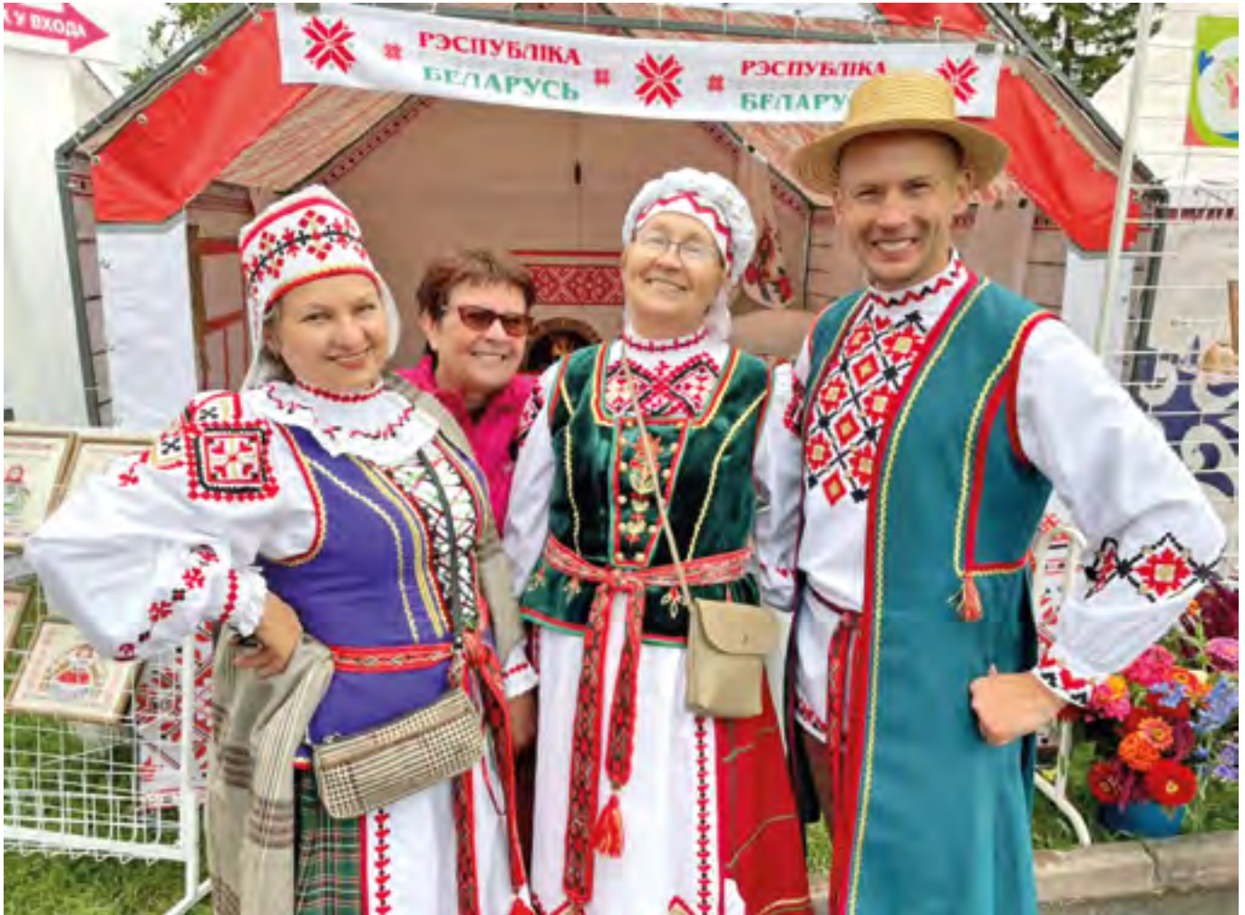
Белорусское землячество на Алтае

Мне показали, как создаются уникальные изделия ручной работы: тканые рушники и скатерти, деревянные тарелки, текстильные куклы, плетёные поделки из соломки, глиняные горшочки и многое другое. Сильное впечатление произвело знакомство с мастерами-ремесленниками и процессом создания их уникальных изделий.